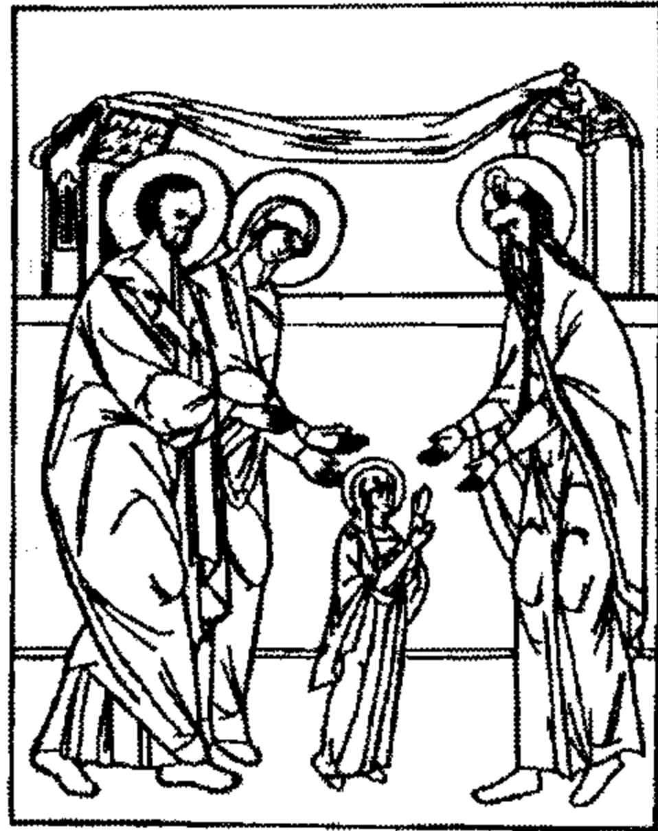
Presentation of Mary

Gospel: Luke 8: 41-56 Epistle: Ephesians 2: 14-22 Sunday Tropar: Tone 7: p. 103. Tropar of Feast of Entrance Tone 4: Today is the prelude of the good pleasure of God,* and the proclamation of salvation for the human race.* In the Temple of God* the Virgin is clearly revealed,* and beforehand announces Christ to all.* To her, then, let us cry aloud with a mighty voice:* Rejoice, fulfillment of the Creator's plan. Glory be: Sunday Kondak: Tone 7: p. 103. Now and for ever: Kondak of Feast of Entrance: The Saviour's pure temple,* the precious bridal chamber and Virgin,* the sacred treasury of the glory of God,* is brought today into the house of the Lord;* and with her she brings the grace* of the divine Spirit.* God's angels sing in praise of her.* She is indeed the heavenly dwelling place. Instead of " Dostoyno ": Seeing the entrance of the pure one, angels marvelled in wonder how the Virgin could enter the holy of holies.